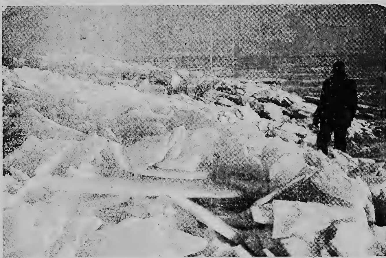
De laatste resten van sneeuw en ijs zijn in de grote steden ingetroeg verdwenen; wie had er dan ook nog gedacht, dat het bij de afsluiting nog niet zo ver zou zijn?

Foto: Een beeld, dat Juddelijk weergeeft, dat Koning Winter zijn terrein niet zonder meer wil verliezen. . . Reu-nachtige brokken ijs liggen er schots en scheef door elkaar, en het ziet er naar uit, dat zij voorlopig nog wel niet verdwenen zullen zijn. Onze fotograaf maakte deze opname in de omgeving van het Kornwerterzand, op de afsluiting.